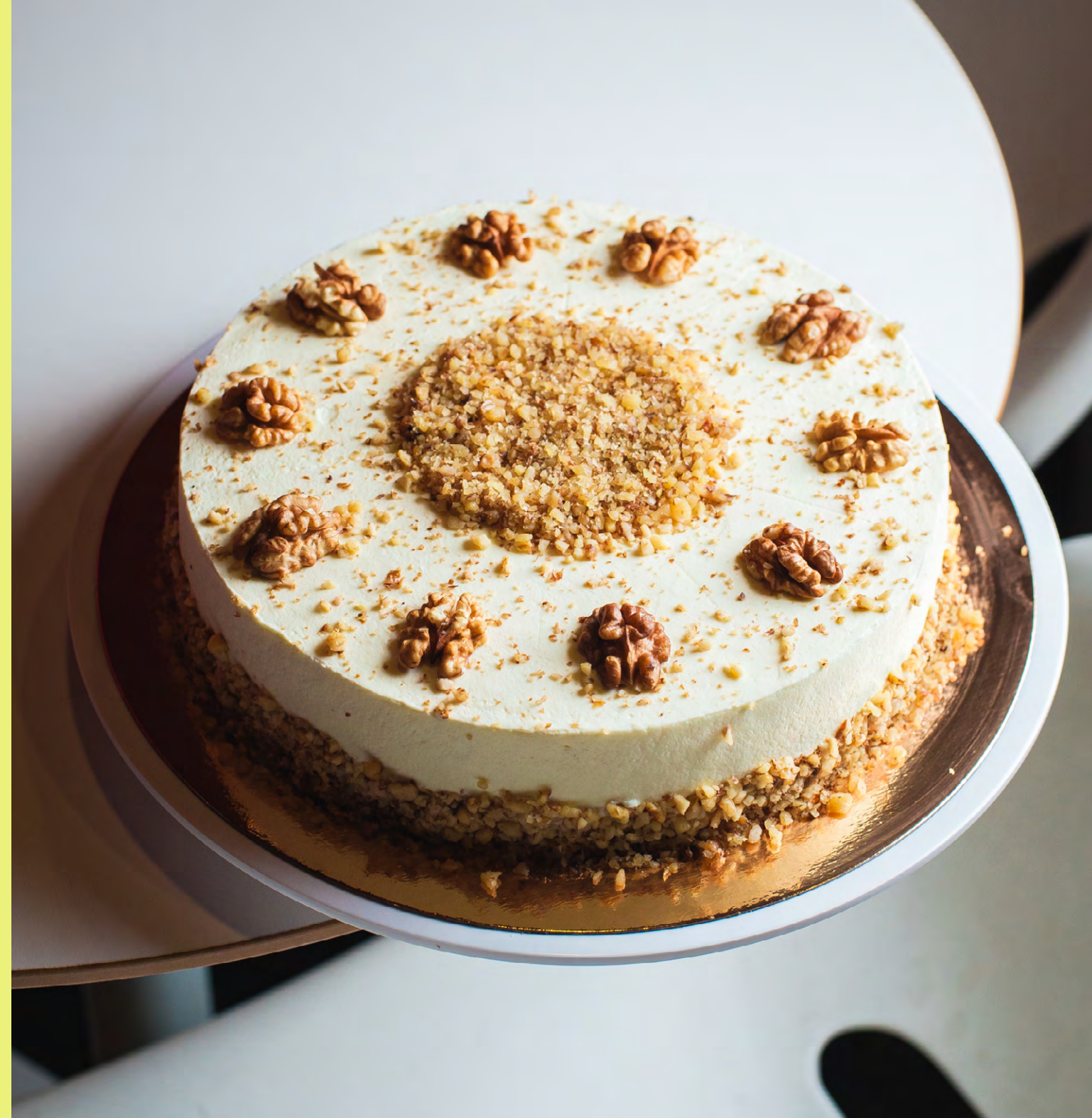
Ciasto marchewkowe z kremem śmietankowo- twarożkowym