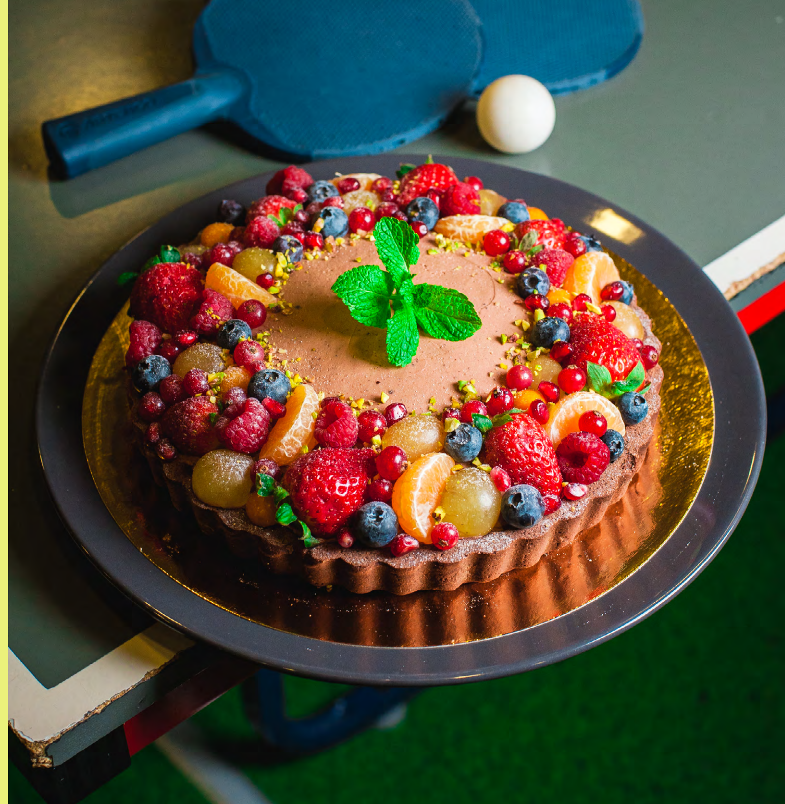
Tarta z kremem mascarpone z mleczną czekoladą i musem malinowym