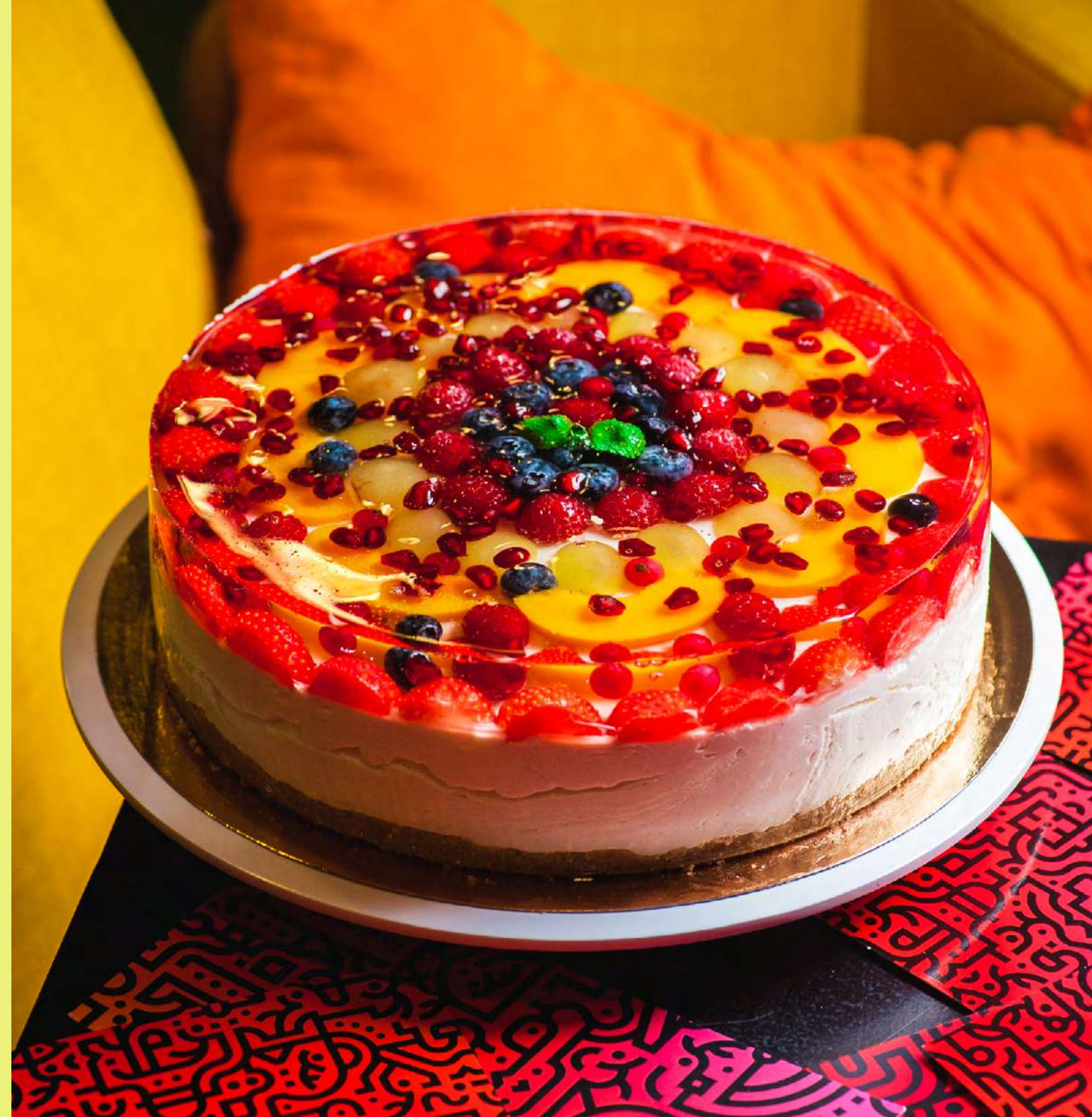
Sernik na zimno z owocami sezonowymi