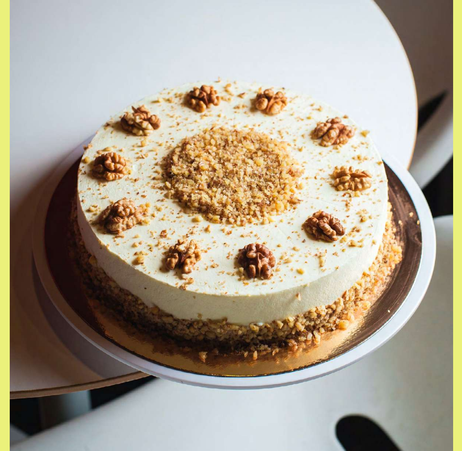
Ciasto marchewkowe z kremem śmietankowo- twarożkowym