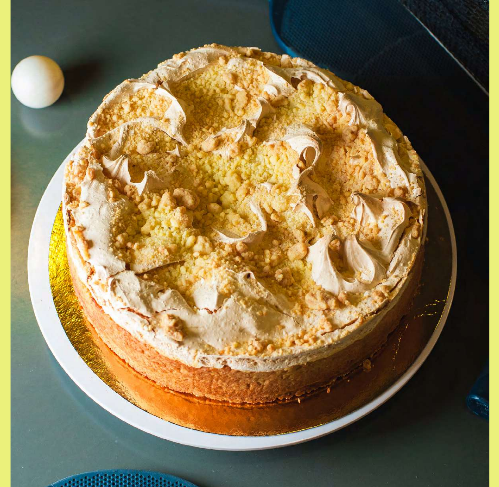
Szarlotka z bezą