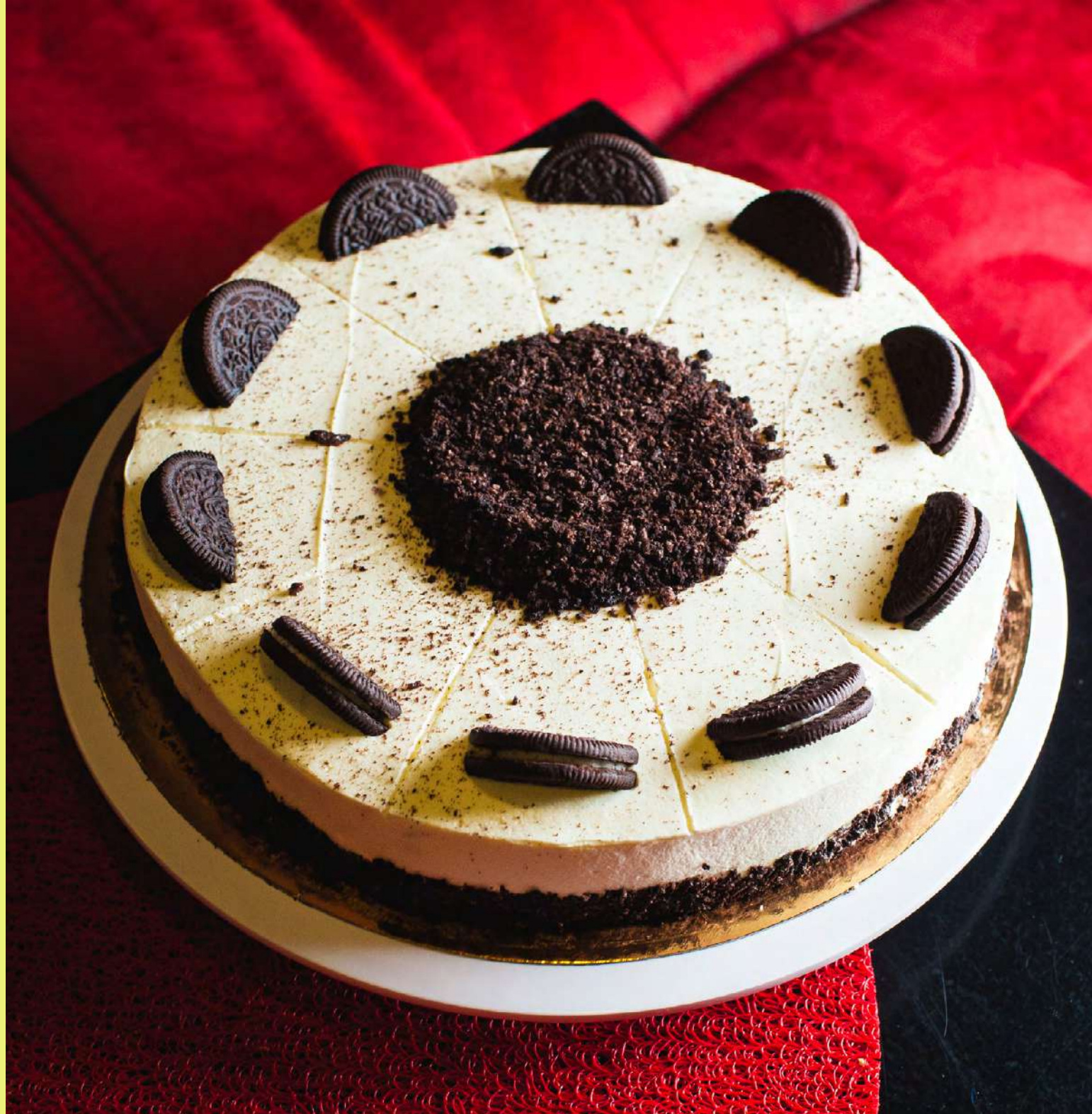
Puszasty sernik Oreo