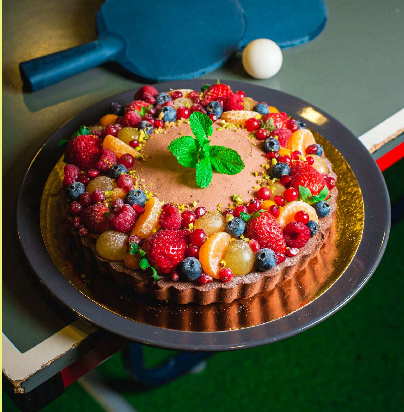
Tarta z kremem mascarpone z mleczną czekoladą i musem malinowym